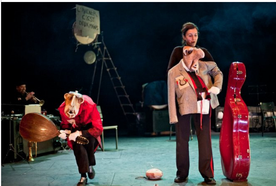
Sur les traces du ITFO par le Turak Théâtre.

Rendez-vous en Turakie pour retrouver l'univers ludique et poétique de Michel Laubu. Un voyage à la rencontre d'un « orchestre fantôme coincé entre la fanfare de chambre et l'électro-pop philharmonique de campagne ».