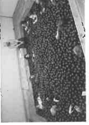
LES THERMES : 2012