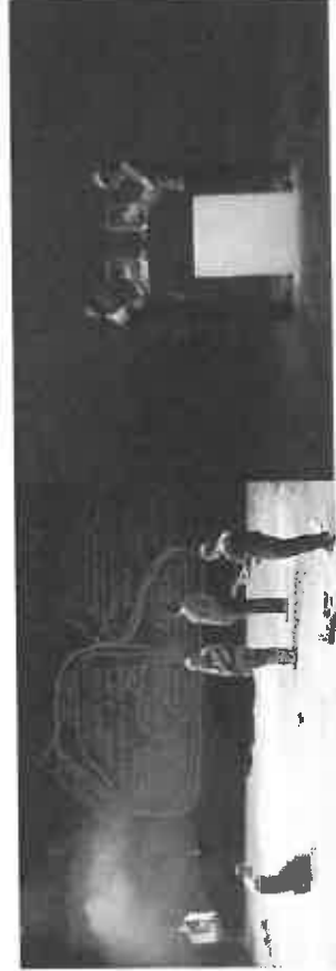
GERMINAL : 2012