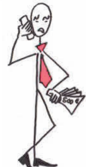
moi patron banquier