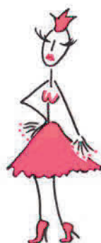
moi, princesse ♥