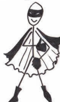
moi Vierge marquée