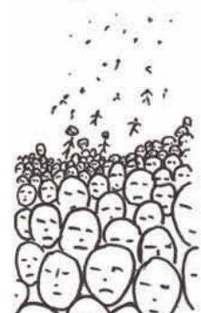
où ça moi ?