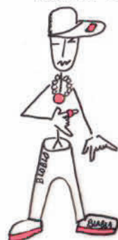
moi raffeur :c