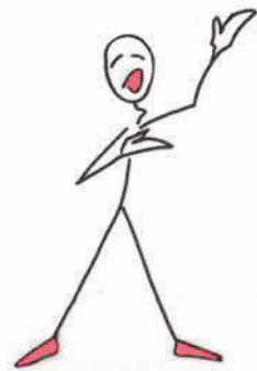
moi charleur ;

Voici les premières esquisses de tentatives de réponse à la question : Mais qu'est-ce que je vais devenir ?