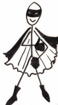
moi vengeur masqué