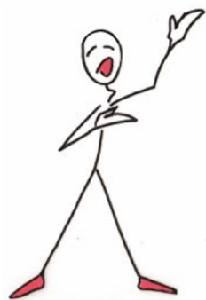
moi chanteur ;

Voici les premières esquisses de tentatives de réponse à la question : Mais qu'est-ce que je vais devenir ?