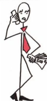
moi patron banquier