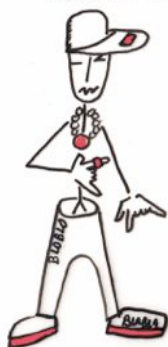
moi rappeur :-: