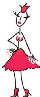
moi, princesse ♥