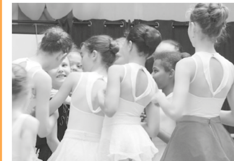
Les Petites danseuses

Programme du 12 octobre au 08 novembre 2020