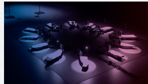
En immersion à La Dynamo