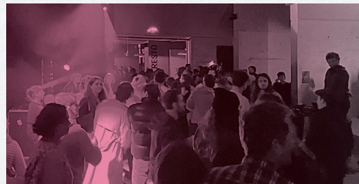
La Nuit MLRX CLUB

Derrière le D.A.M.E se cache l'axe numérique alpin avec les différents acteurs du territoire qui font vivre les musiques électro et les arts numériques en Savoie et alentours. Le Collectif d'artistes L'Endroit, La Base tiers-lieu, l'Hexagone scène nationale arts et sciences à Meylan, la Dynamo, et Malraux scène nationale donnent vie à un parcours d'événements : concerts, DJ set, installations, expos, spectacles, conférences, cinéma... Allez, dis bonjour au D.A.M.E !