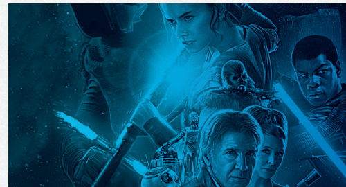
Star Wars : Le Réveil de la Force