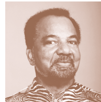
Figure de proue de la musique angolaise et lusophone à la voix chaude et puissante, Bonga nous présente Kintal da Banda , son 32 e album qui marque ses 50 ans de carrière. Un opus solaire qui évoque avec tendresse des souvenirs et instants précieux de la samba qu'il a popularisée mondialement.